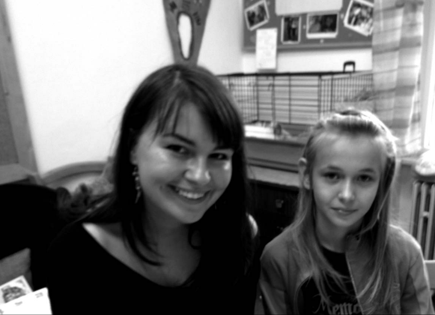
— Dvojice Pět P v Ústí nad Labem