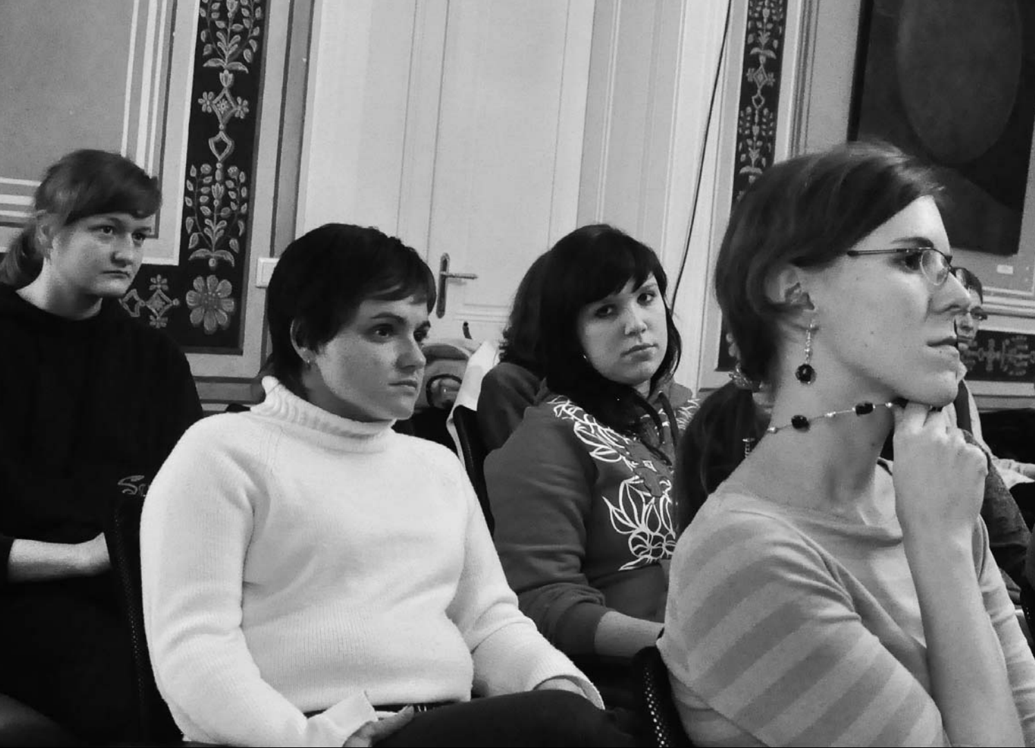
— Jednání koordinátorů Pět P z celé České republiky