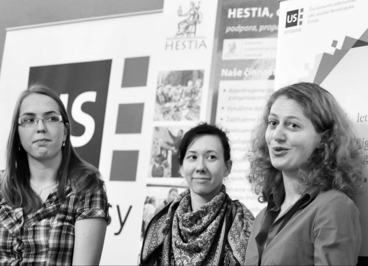
— Slavnostní konference Programu Pět P v Americkém centru, Praha