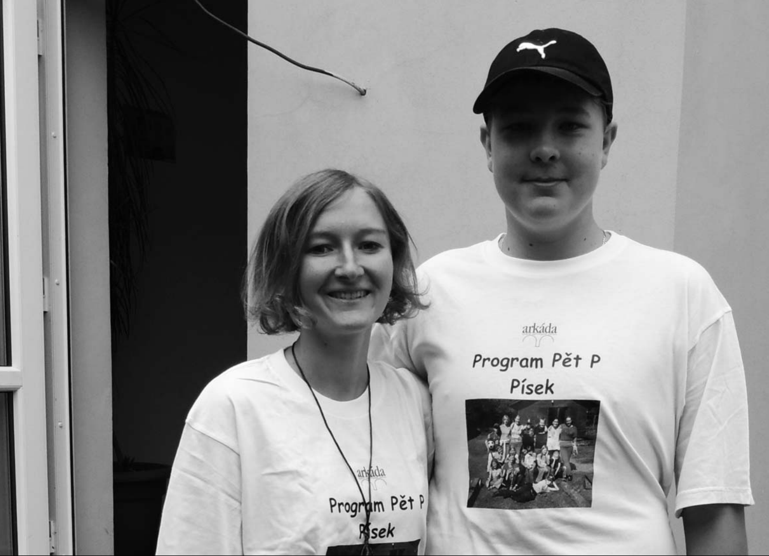
— dvojice programu Pět P v Písku