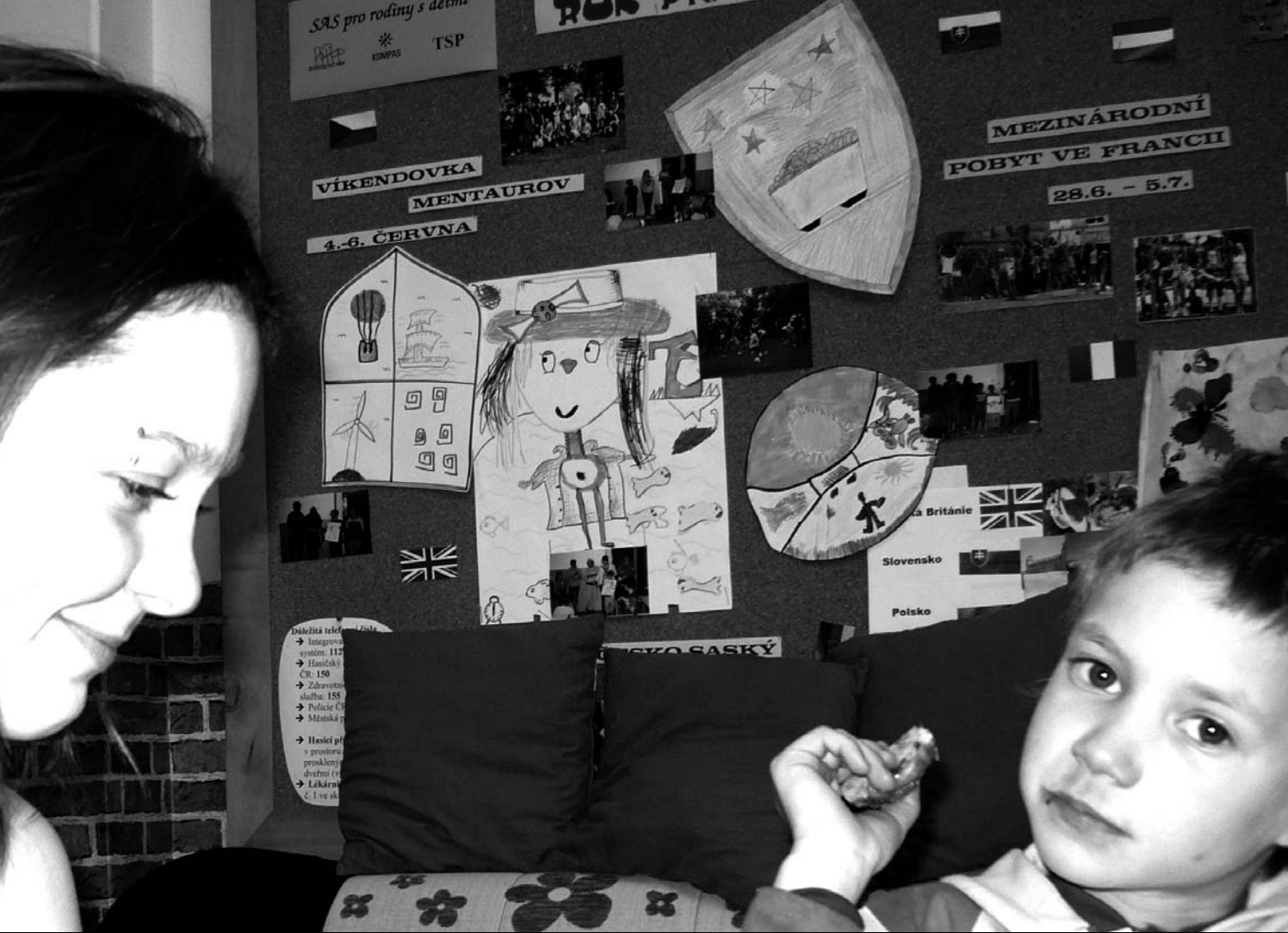
— Společný čas vyplněný zábavou i trochou učení