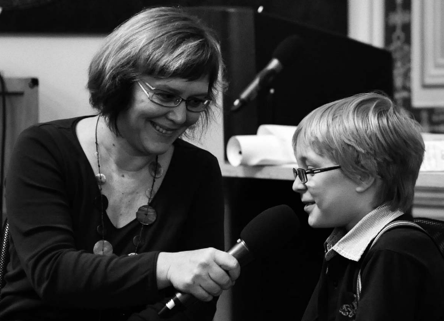
— Redaktorka Českého rozhlasu při rozhovoru s účastníkem Programu Pět P