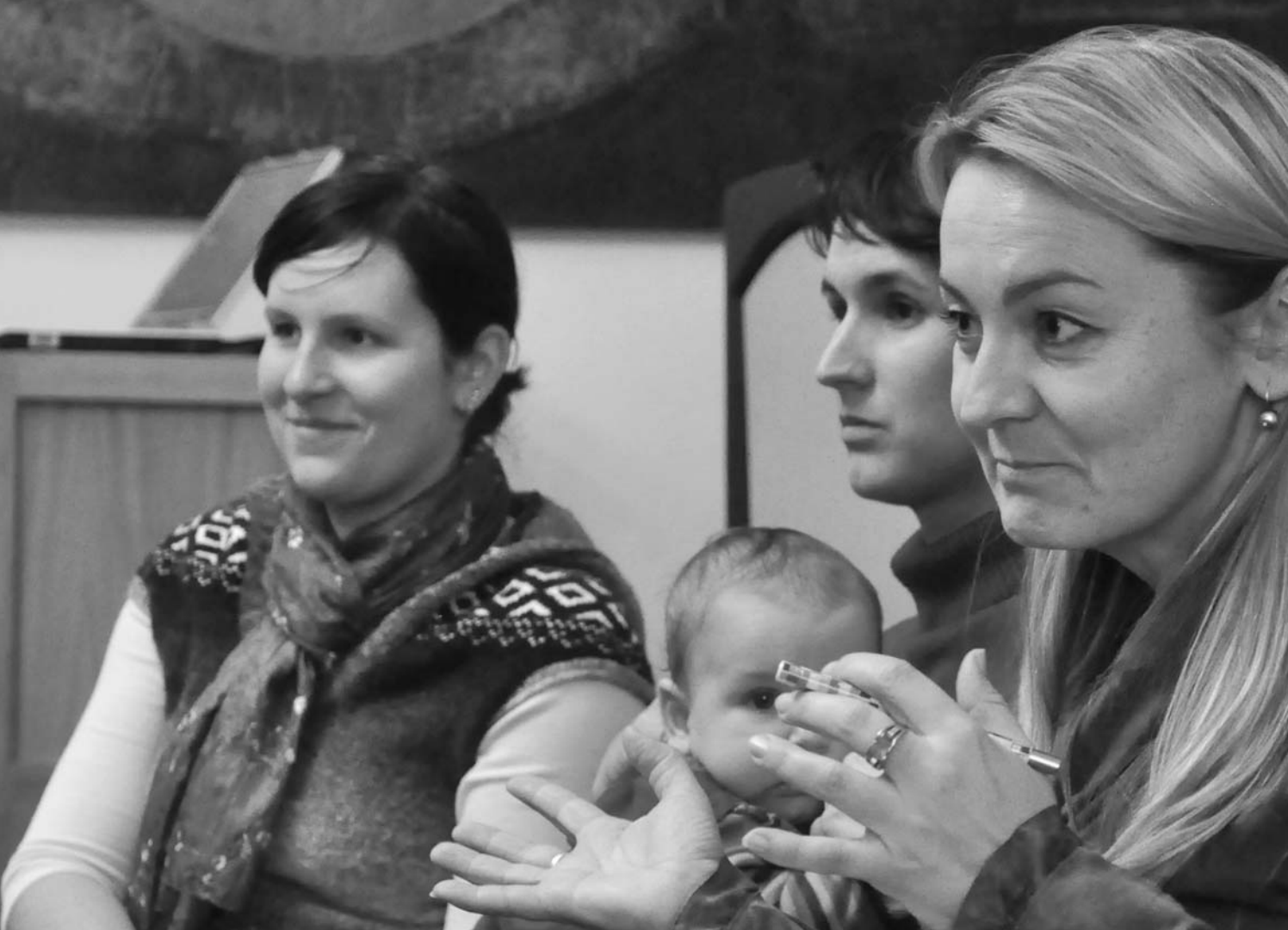
— Workshop koordinátorů Programu Pět P